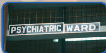
SEVERE MENTAL DISORDERS