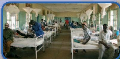
GENERAL AND MENTAL HEALTHCARE IN TANZANIA